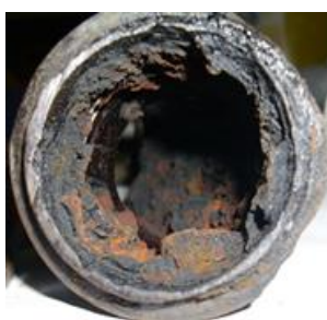
Mangan - schwarz