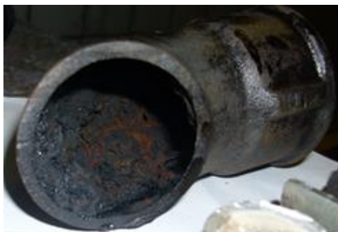
Abbildung 2: vor der chemischen