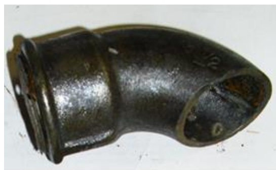
Abbildung 3: nach der chemischen